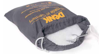
Wachspastillen zum Nachfüllen SFP2 2kg SFP4 4kg