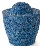
Duftspeicher Porosium zum Duftwechsel Ø 5,6 cm | H 6 cm | 0,2 kg