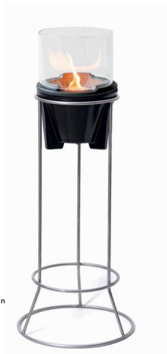
Roestvrij stalen standaard