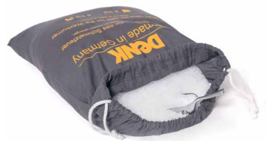
Waspastilles voor het bijvullen SFP2 2 kg SFP4 4 kg