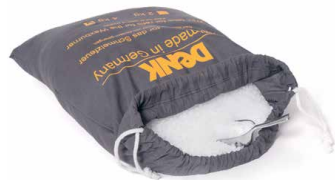
Wachspastillen zum Nachfüllen SFP2 2kg SFP4 4kg