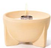
Schmelzfeuer Indoor CeraNatur ® SFDI | H 8 cm | Ø 13 cm | 0,8 kg

Da sich die Formen der verschiedenen Schmelzfeuer-Modelle unterscheiden, bitte unbedingt das/die betreffende/n Modell/e ankreuzen.