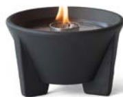
Schmelzfeuer Indoor CeraLava ® SFCI | H 8 cm | Ø 13 cm | 0,6 kg