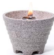
Schmelzfeuer Indoor Granicum ® SFGI | H 9 cm | Ø 12,5 cm | 0,8 kg