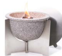
Schmelzfeuer Indoor M Granicum ® SMGI | H 11,5 cm | Ø 15 cm | 1,0 kg